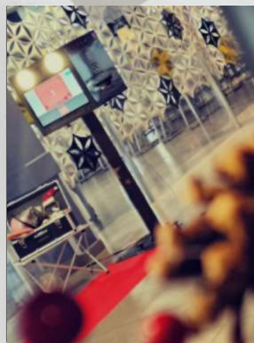
La borne la plus solide et stable du marché !