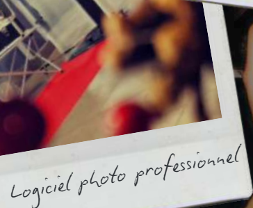
Logiciel photo professionnel